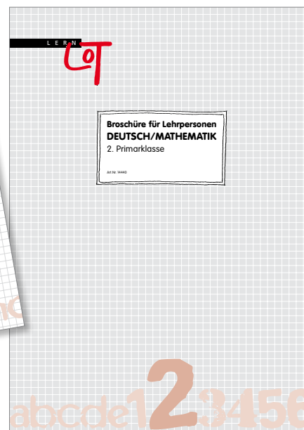
Broschüre für Lehrpersonen