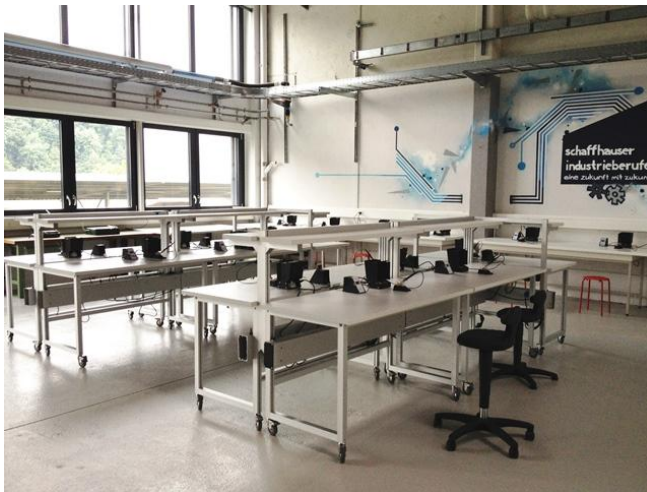
Werkstatt im go tec! Labor