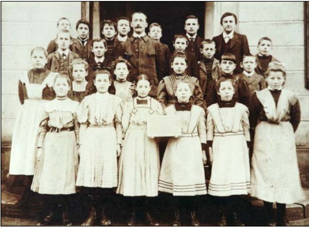
Erinnerungen an Schulkameraden und -Kameradinnen