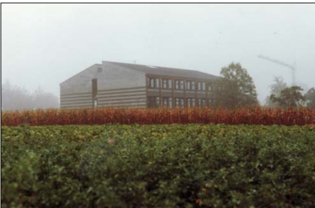
Erinnerungen an die Einweihung des Wislischulhauses