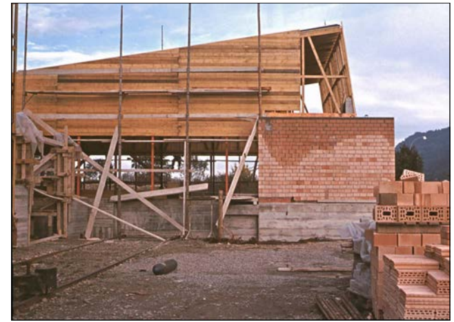
Erinnerungen an den Bau der Aula