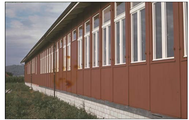
Erinnerungen an die Schulzeit im Pavillon