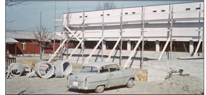
Erinnerungen an den Bau der Turnhalle