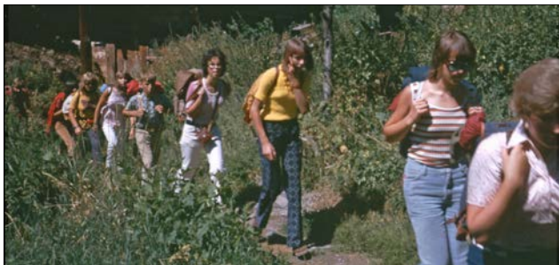
Erinnerungen an Schulreisen und Schulverlegungen