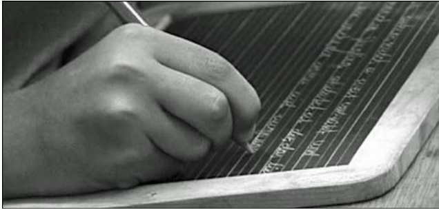
Erinnerungen die eigenen Schulanfänge